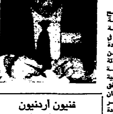
فنيون اردنيين للحرس الوطني السعودي

موسكو - رويتر - سمي التعهد للسوفييتي امس المستر اتقولي انيسيموفا خلفا للمستر بيور سايو سايو كسبر سوييتي الذي ارتد . وقد توفرت اية معلومات بعد من حياة المستر انيسيموفا .